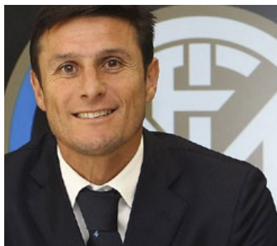
Javier Zanetti Vicepresidente F.C. Internazionale Milan