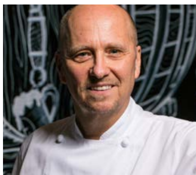
Heinz Beck Chef del ristorante La Pergola premiato con tre stelle Michelin